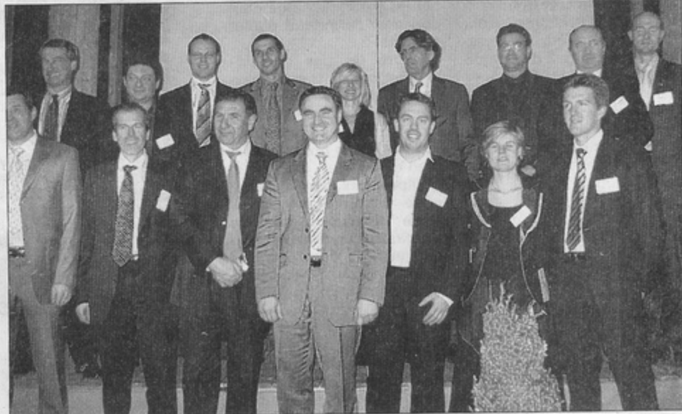
Soutenues par le Réseau, dix entreprises volent désormais de leurs propres ailes. Le DL / C. P.

Venant de différents secteurs du département (on a noté une forte représentation du site d'Archamps, de